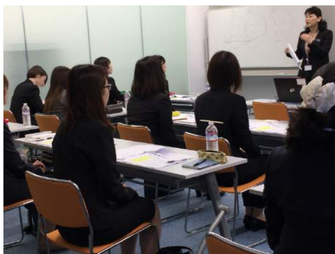
※プログラム初日、講師によるマナー研修の様子

この度、正社員を目指す女性を対象とした就業支援事業を名古屋営業所でスタートいたしました。20代女性を対象に、研修や面接対策、カウンセリングを行った上で、複数の企業担当者にご紹介、面接を行う、4日間の就業支援集中プログラムです。